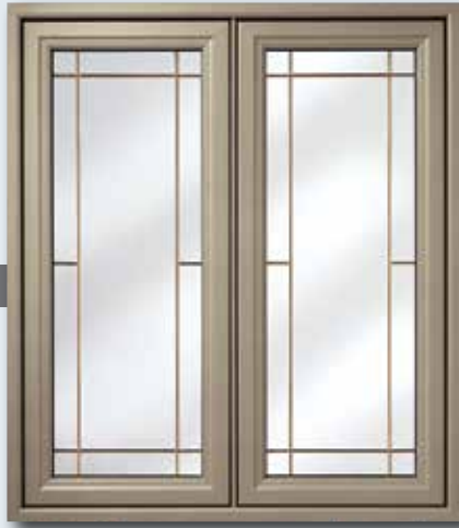
Duo Plus 4 1/2