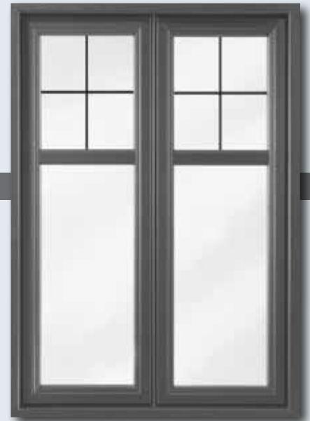
Duo Plus 5 1/2