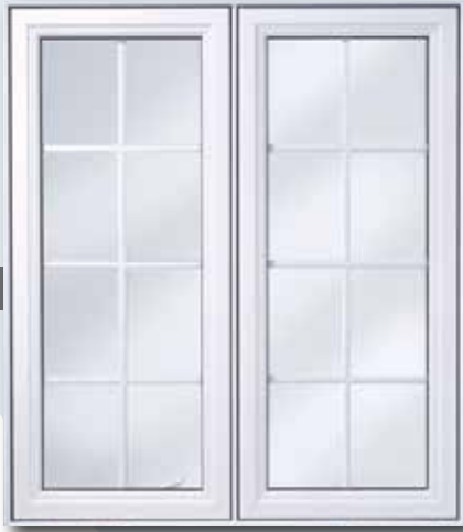
Duo 4 1/2